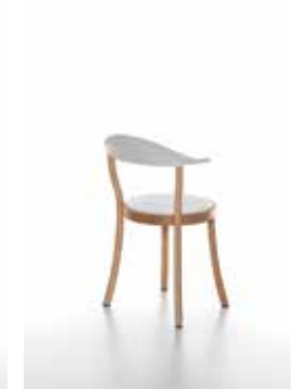
Image: Plank_BISTRO_beech_white_02