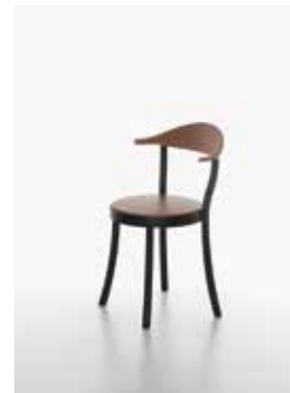
Image: Plank_BISTRO_beech/B_caramel_01