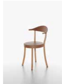
Image: Plank_BISTRO_beech_caramel_01

Chair, beech wooden structure natural lacquered or black stained-lacquered. Backrest in polypropylene in the colours black, white, caffè latte, caramel, terra brown. Seat made of flexible integral skin polyurethane foam matched to the backrest colours.