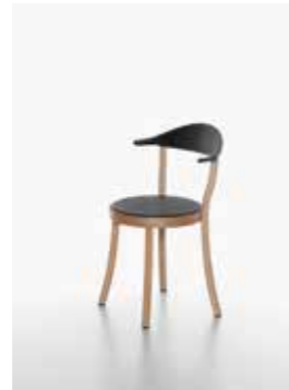
Image: Plank_BISTRO_beech_black_01