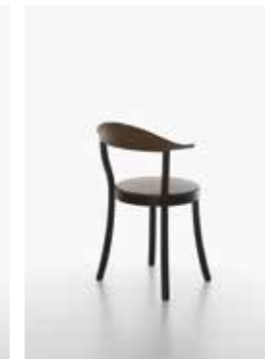
Image: Plank_BISTRO_beech/B_brown_02