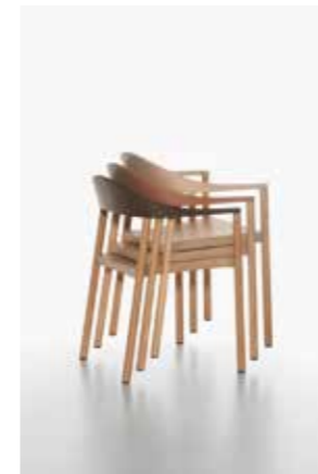
Image: Plank_MONZA_armchair_oak_01

Armchair stackable, structure in ash, oak or walnut natural lacquered or ash black or white stained- lacquered. Backrest in polypropylene in the colours black, white, traffic red, wine red, light blue, yellow green. New additional colours cafe latte, caramel, terra brown.