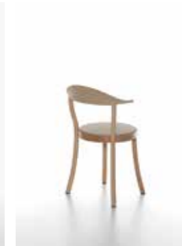
Image: Plank_BISTRO_beech_cafelatte_02