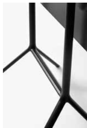
Image: Plank_MIURA table_extended base_06