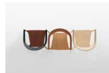
Image: Plank_MONZA_armchair_walnut, oak, ash