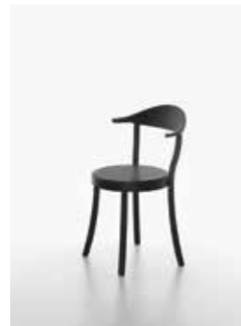
Image: Plank_BISTRO_beech/B_black_01