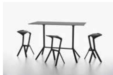
Image: Plank_MIURA table_extended base_04