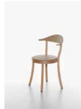
Image: Plank_BISTRO_beech_cafelatte_01