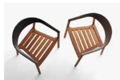
Image: Plank_MONZA_outdoor_group_02