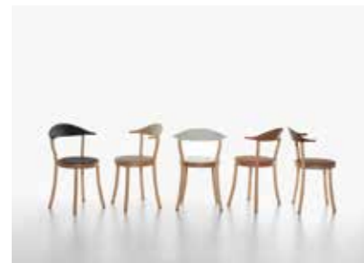
Image: Plank_MONZA BISTRO_group_01