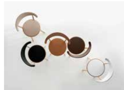
Image: Plank_MONZA BISTRO_group_02