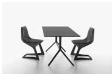
Image: Plank_MIURA table_extended base_05