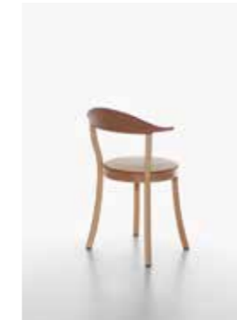
Image: Plank_BISTRO_beech_caramel_02