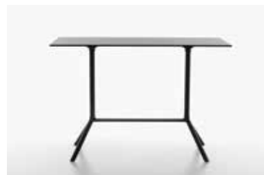
Image: Plank_MIURA table_extended base_01

Armchair, massive iroko wooden structure, oil treated. Backrest in polypropylene in the colours black, cafe latte, caramel, terra brown. Outdoor and Indoor use.