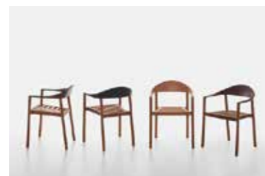
Image: Plank_MONZA_outdoor_group_01