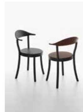
Image: Plank_MONZA BISTRO_group_03