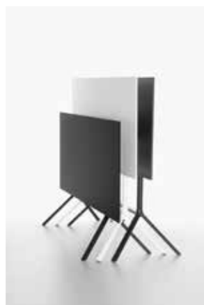
Image: Plank_MIURA table_extended base_07