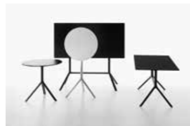
Image: Plank_MIURA table_extended base_03