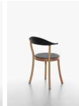
Image: Plank_BISTRO_beech_black_02