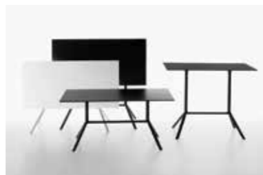
Image: Plank_MIURA table_extended base_02