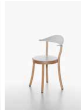
Image: Plank_BISTRO_beech_white_01