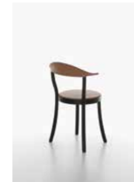
Image: Plank_BISTRO_beech/B_caramel_02