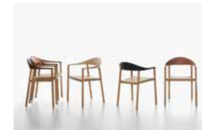
Image: Plank_MONZA_armchair_ash_01